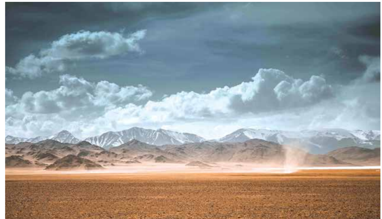
Памирская магистраль, Таджикистан

Это определяется тем, что только около 1 % CO 2 в атмосфере имеет антропогенное происхождение, в то время как многолетняя изменчивость почти 99 % содержащегося в атмосфере CO 2 на 97,6 % связана с многолетней изменчивостью инсоляционной контрастности. В случае реализации проекта энергетического перехода содержание CO 2 в атмосфере к 2050 году можно сократить