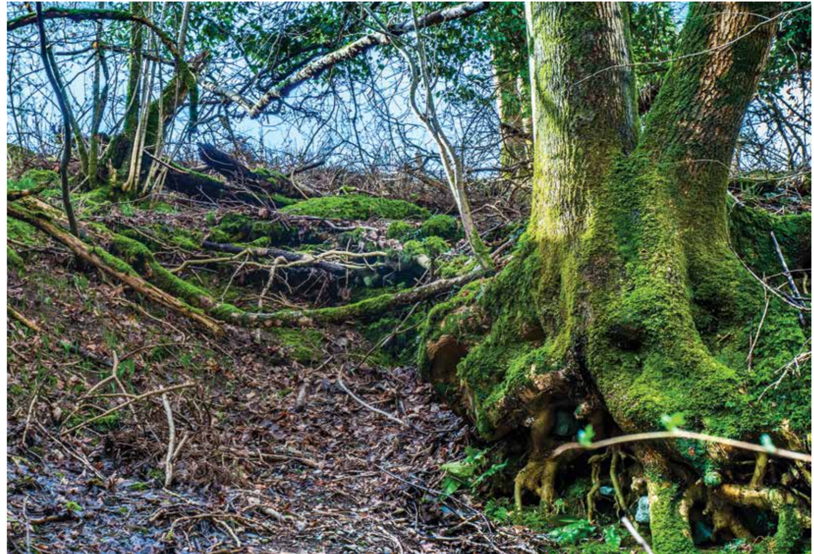
Леса вносят серьезную лепту в борьбу с изменениями климата

Работа выполнена в соответствии с государственной темой «Эволюция, современное состояние и прогноз развития береговой зоны Российской Арктики» (121051100167-1).