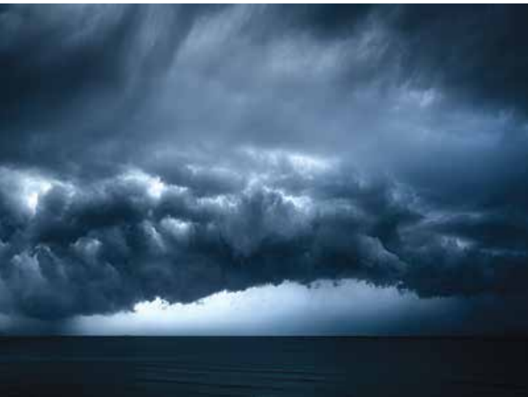
Грозовые тучи над морем

Человечество не может повлиять на изменение глобального климата переходом на безуглеродную энергетику, поскольку эти изменения определяются естественными причинами и находятся за пределами энергетических возможностей человечества. К естественным изменениям климата экономически и социально следует адаптироваться заблаговременно, что возможно только на основе прогнозов, базирующихся на реальных естественных факторах этих изменений. Экологические проблемы можно и нужно решать. При этом, связанные с деятельностью человека проблемы загрязнения атмосферы, водных и земельных ресурсов можно решать более эффективно, если отделить вопросы изменения глобального кли-