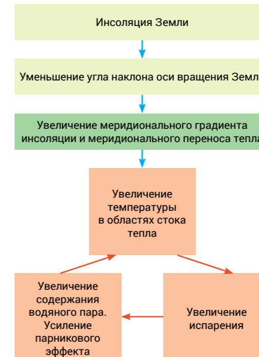
Рис. 2. Принципиальная схема радиационного теплообмена в атмосфере

Содержание такого парникового газа как метан составляет всего несколько миллиардных частей в единице объема воздуха (0,00018%), то есть в 220 раз меньше общего содержания CO 2