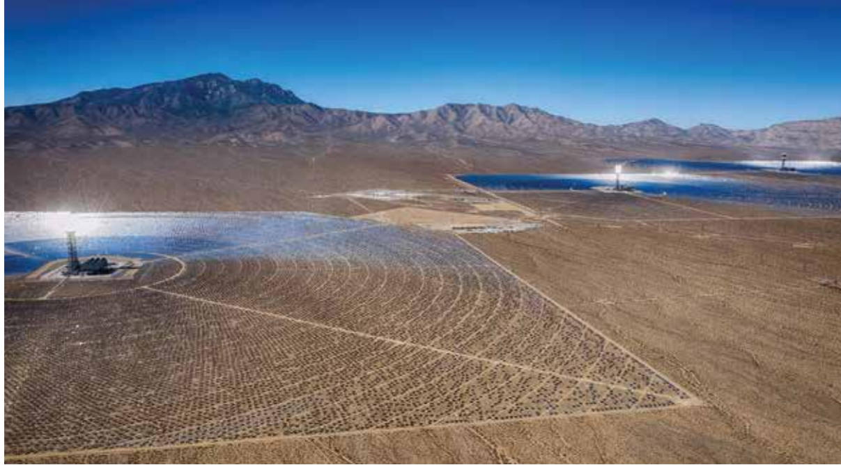
Солнечная плантация в пустыне Моджаве. Калифорния, США