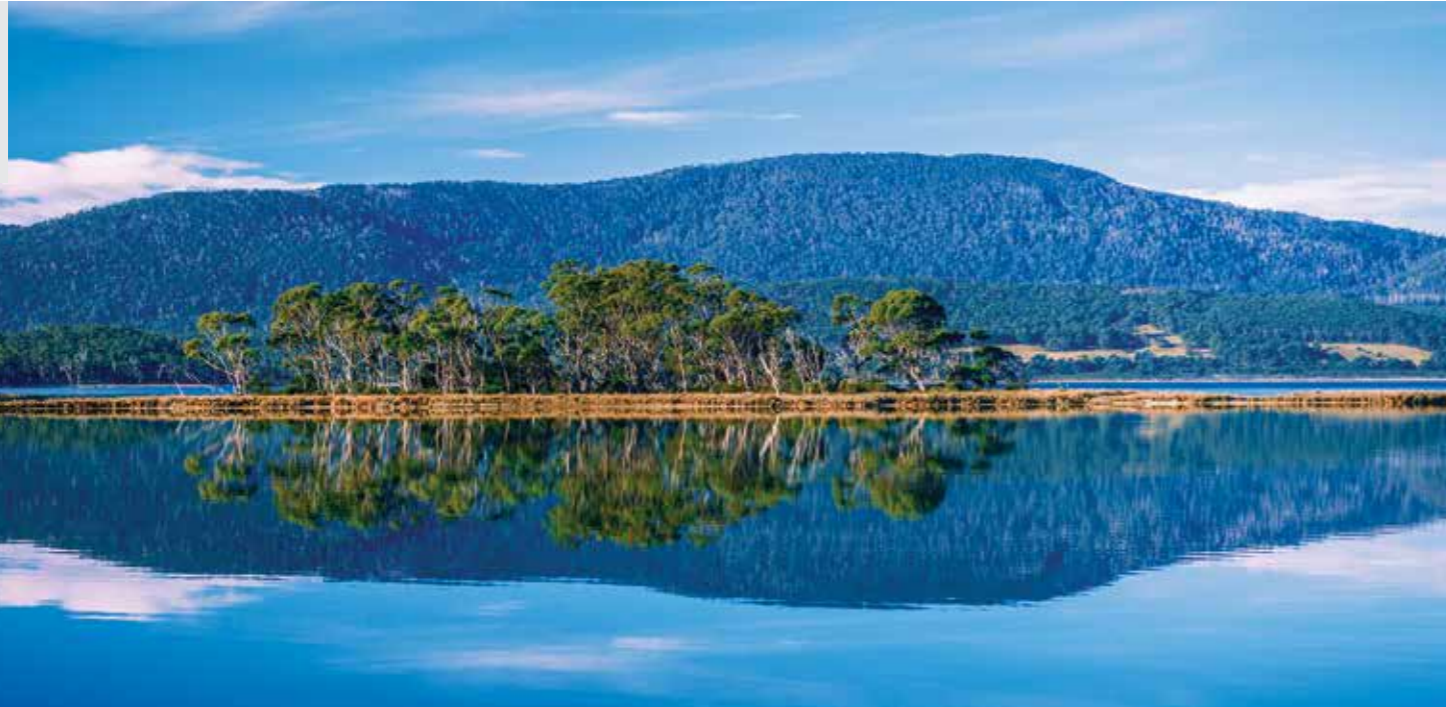
Остров Бруни в Тасмании, Австралия